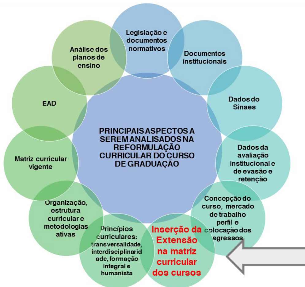
Figura 1: Aspectos a serem analisados na reformulação curricular de cursos de graduação