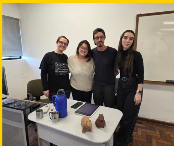
Capivaras da Sarmento