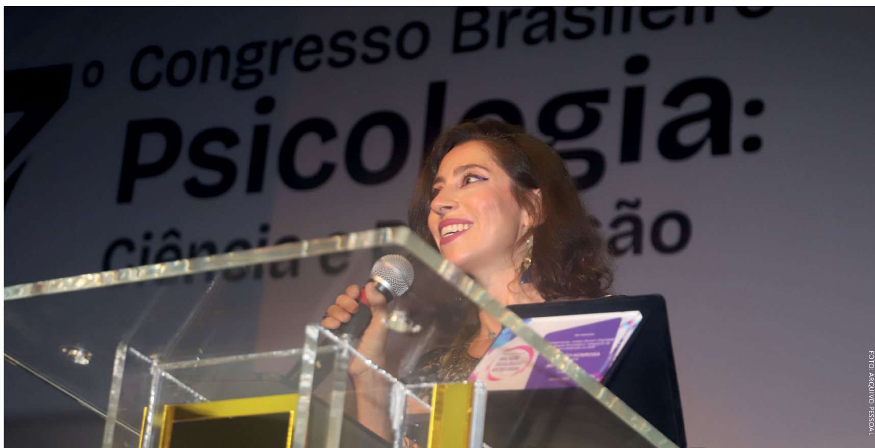
Menção honrosa reconheceu práticas de extensão no SUS

A professora defende que a formação em Psicologia deve integrar teoria e prática desde o início do curso, favorecendo espaços de aprendizagem em que os estudantes possam problematizar casos reais e complexos. "É preciso superar modelos exclusivamente expositivos e fragmentados, oferecendo experiências que mobilizem tanto o domínio técnico quanto a compreensão crítica dos contextos em que a avaliação se insere", destaca.