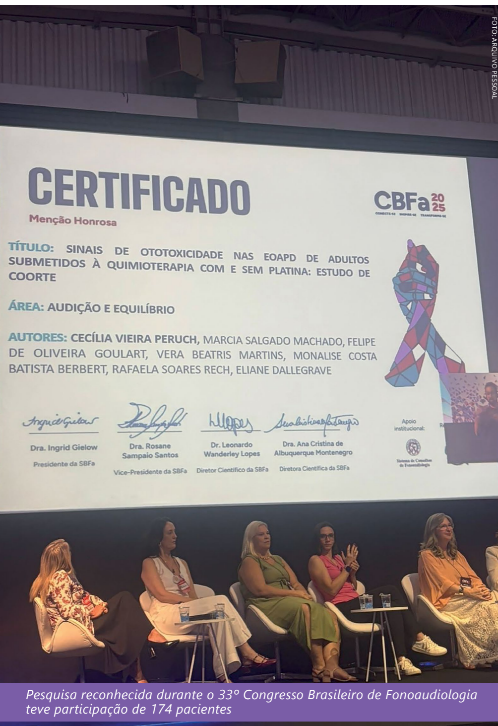
Pesquisa reconhecida durante o 33º Congresso Brasileiro de Fonoaudiologia teve participação de 174 pacientes